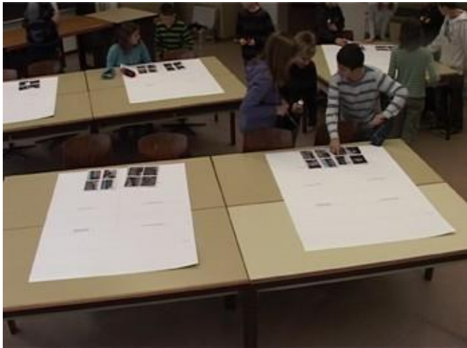
Abbildung 1: Videografie der beiden Unterrichtssequenzen